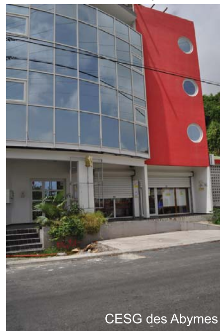
CESG des Abymes

Responsable budgétaire CGSS : Mme Maryse OTZ - Tél. : 0590 90 51 55